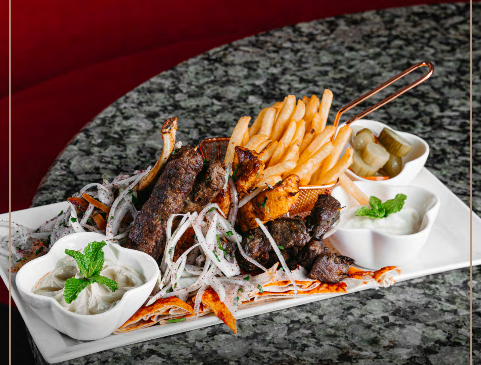
مشويات شرقية مشكلة