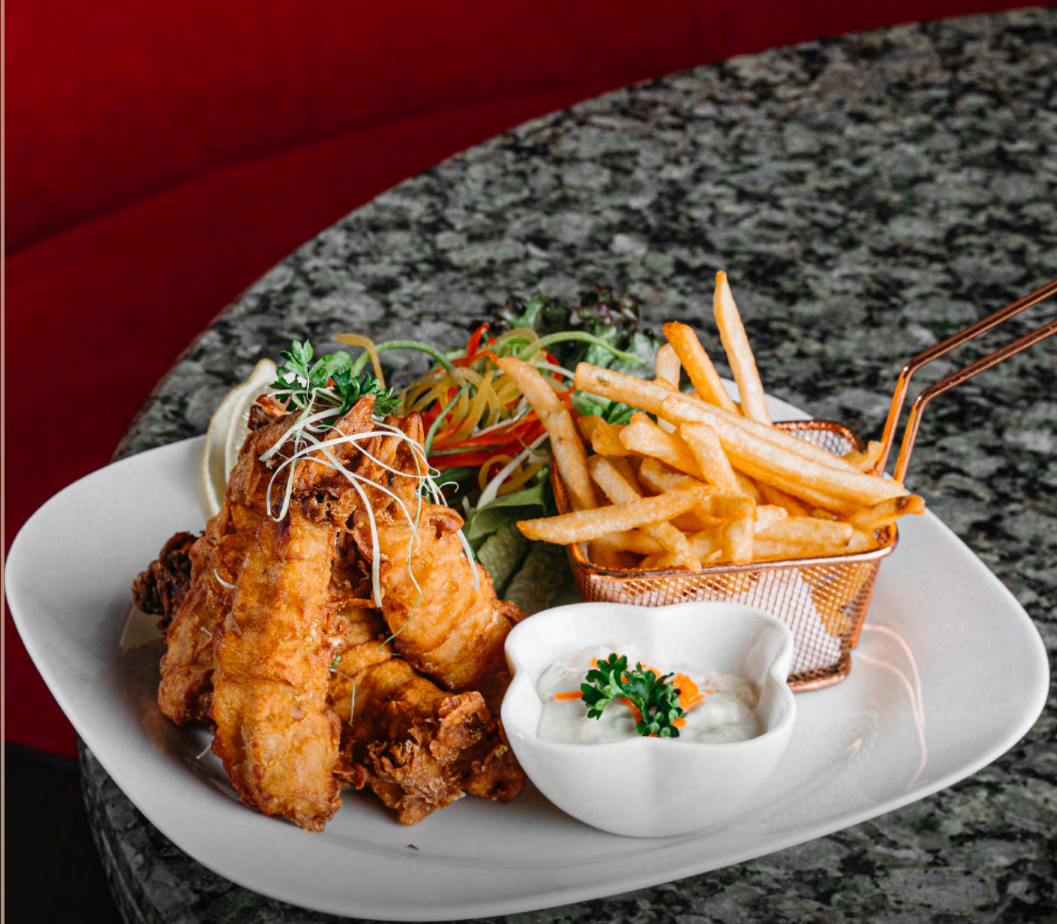
روبيان النمر تمبورا