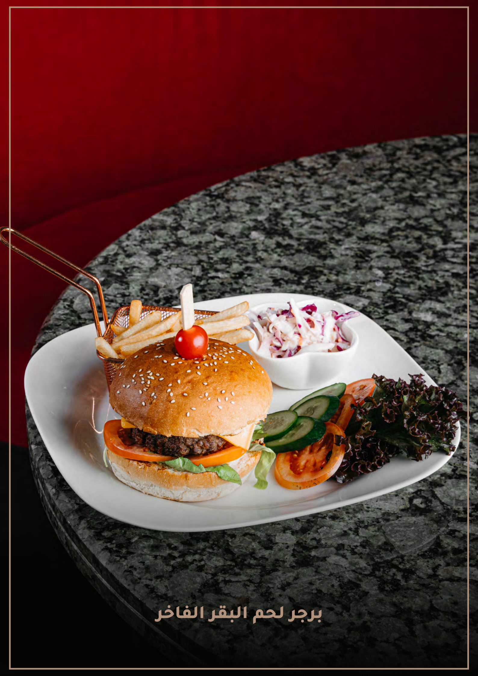
برجر لحم البقر الفاخر