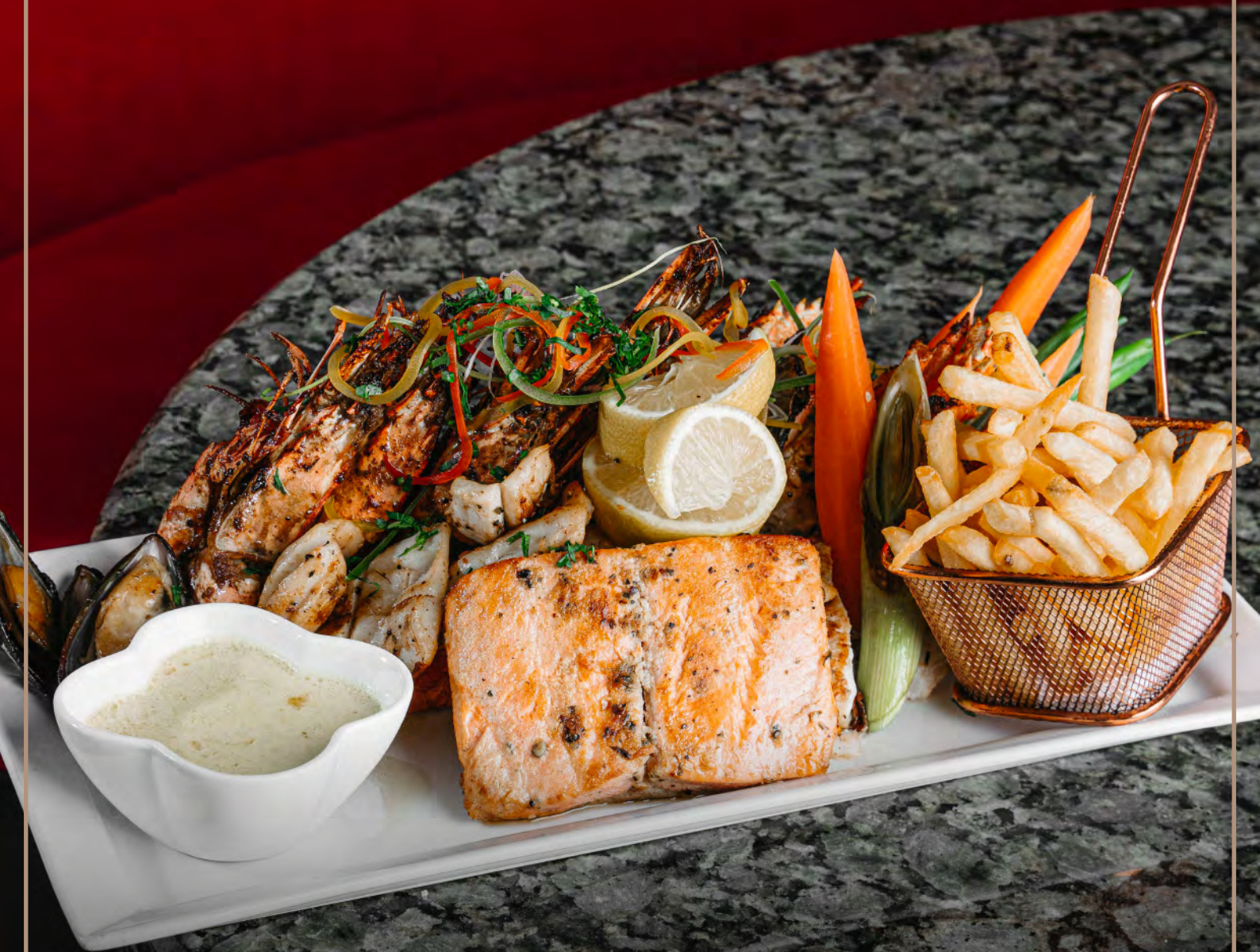
طبق المأكولات البحرية